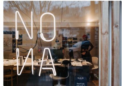
NONA Architektinnen Foto: Angela Lamprecht