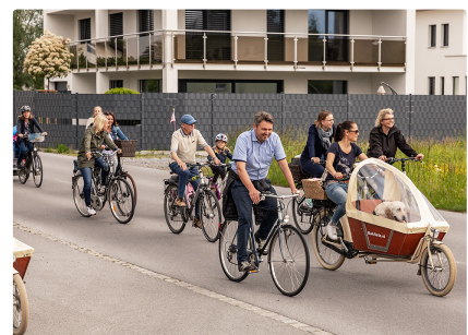
Fahrradfahren in Lustenau