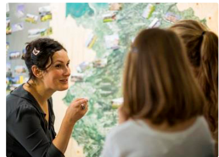
Baukultur im Unterricht

Mit einem kurzen Film und einigen persönlichen Eindrücken frisch von der aktuell laufenden Abschlussausstellung der IBA Heidelberg lenkt vai-Direktorin und IBA-Kuratoriumsmitglied Verena Konrad den Blick auf die Vernetzung von Bildungsthemen und urbaner Entwicklung und macht Lust auf einen Besuch in Heidelberg.