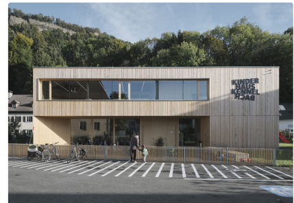
Kinderhaus Kennelbach