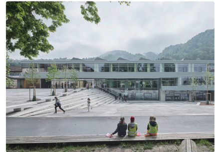
Volksschule Haselstauden