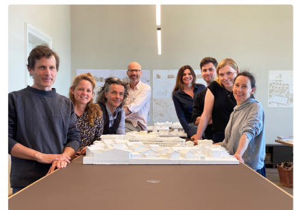
Team Ludescher+Lutz Architekten