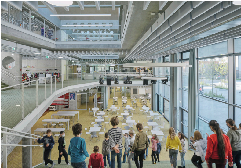
Volksschule Haselstauden, Dornbirn Architektur: Fasch&Fuchs Architekten

Die elfte Ausgabe der Architekturtage erstreckte sich über ein ganzes Jahr und stellte unter dem Thema „Architektur und Bildung: Leben Lernen Raum“ innovative Bildungsbauten und Konzepte in ganz Österreich vor. Nun laden wir von 9. bis 11. Juni 2022 zum großen Finale.