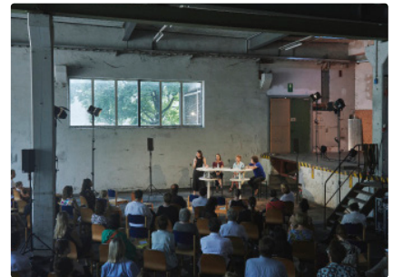
CampusVäre | Creative Institute Vorarlberg

Mit Theresa Bubik, CampusVäre, und Erich Wutscher, Leitung Hochbau Stadt Dornbirn, werden die alten Sägenhallen besichtigt. Sie geben einen Einblick in die Pläne und künftigen Entwicklungen am Campus V.