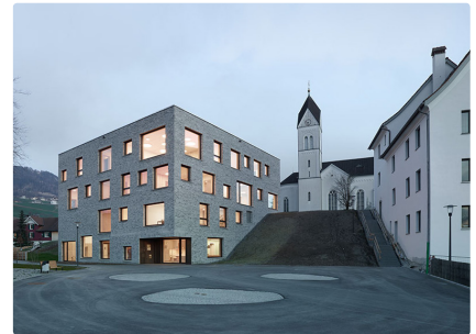
Kinderhaus Sulz

Das preisgekrönte Kinderhaus öffnet seine Türen für Interessierte. Architekt Jochen Specht führt durch das Gebäude.