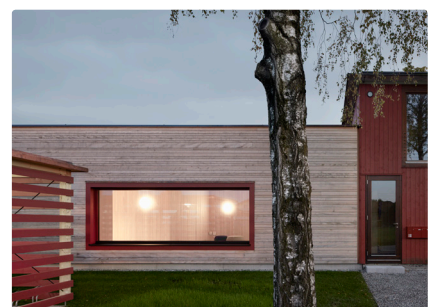
Kindergarten Am Schlatt