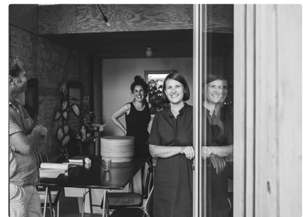
Julia Kick Architekten