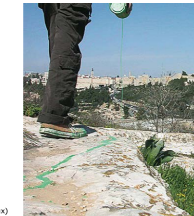
Francis Alÿs: Green Line

Steinwurf vom alten Rhein entfernt, an dem sich ab 1938 Flüchtlingsdramen abspielten, deren Gegenwart wir heute an den Rand unseres Bewusstseins drängen.