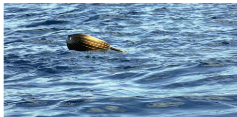
Pinar Öğrenci: A Gentle Breeze Passed Over Us, 2017 (Filmstill)

Ausgehend von der biblischen Erzählung von der Flucht der Efraimiten vor den siegreichen Gileaditern und ihrem tödlichen Scheitern an den Ufern des Jordans, lädt das Jüdische Museum Hohenems internationale Künstler dazu ein, Grenzen in aller Welt kritisch zu betrachten – nur einen