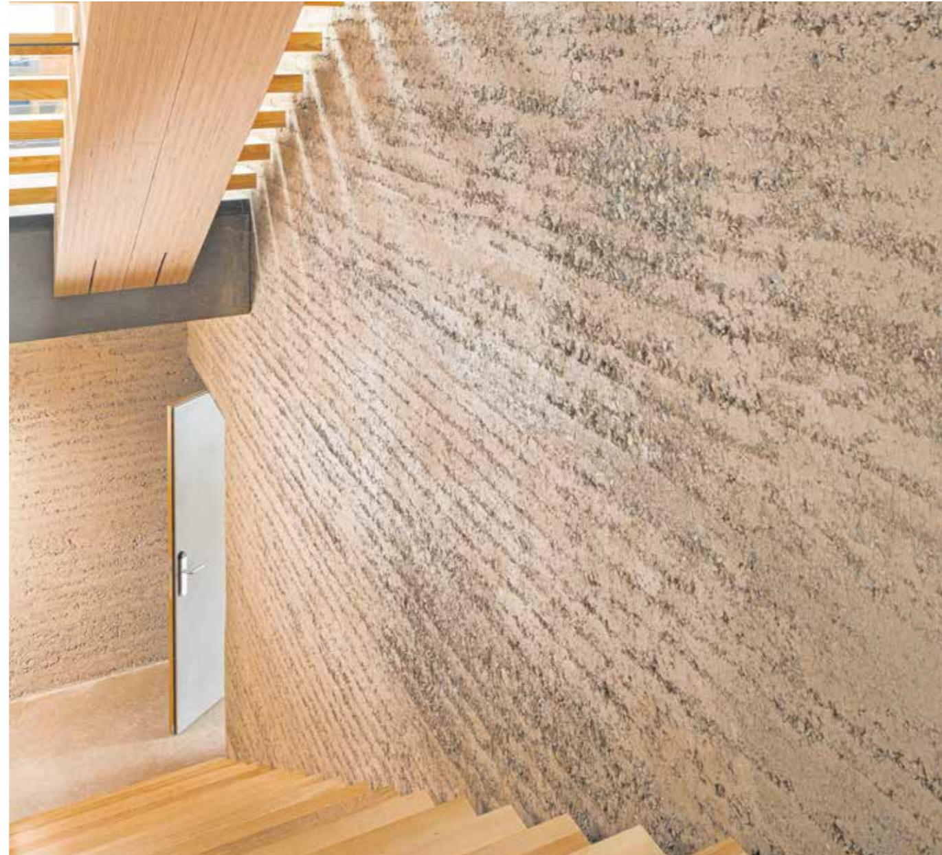
Die zentrale Holzstiege des Bürobaus verbindet die drei Geschoße, durch ein Dachfenster strömt Tageslicht.