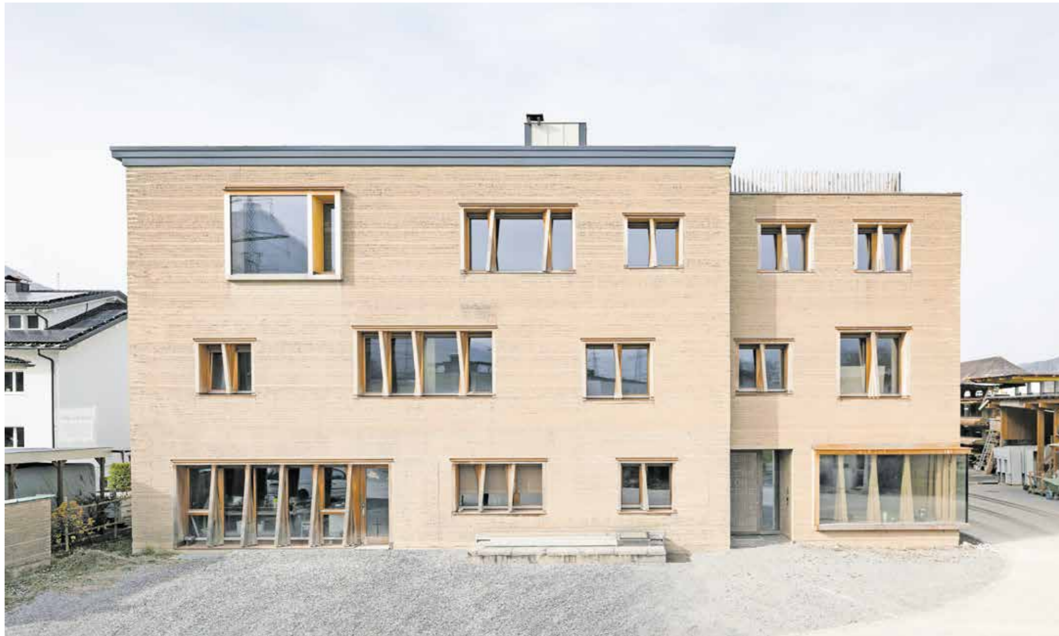
SCHAUFENSTER Lehm-bau: Mit einem Eckfenster öffnet sich die Ausstellungsfläche im neuen Bürogebäude von Lehm Ton Erde Baukunst für neugierige Blicke.