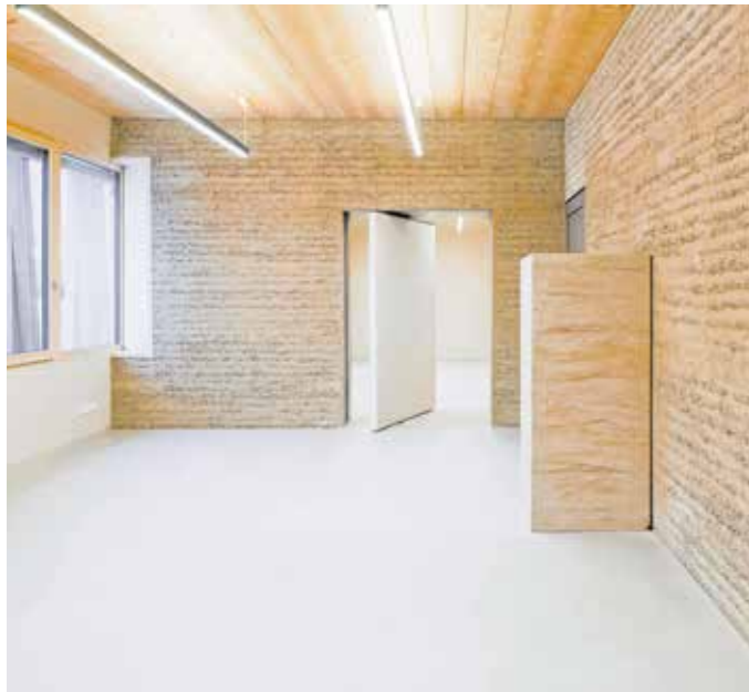
Auch die großen Türen des Gebäudes sind aus Lehm. Das Material wird in all seinen Facetten und in seinen sinnlichen Oberflächenstrukturen erlebbar.