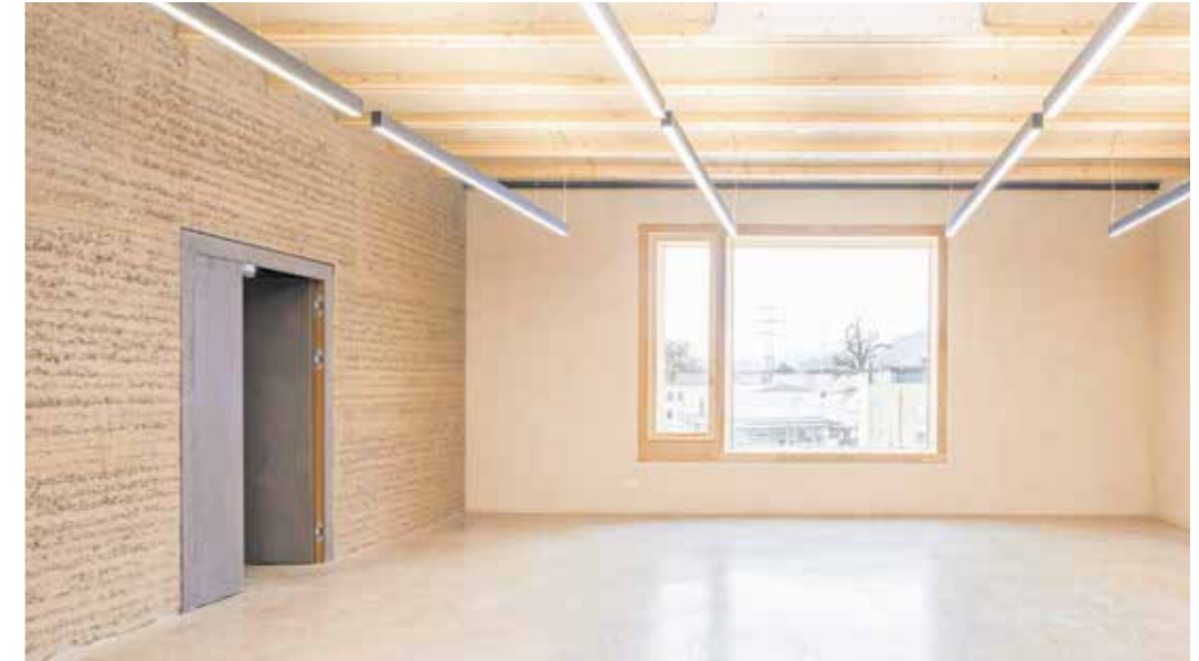
Im Seminarraum ist eine innovative Decke aus vorgefertigten Lehm-Holz-Gewölbemodulen eingesetzt. Lehm Ton Erde Baukunst hat sie kürzlich gemeinsam mit dem Schweizer Holzbauunternehmen Blumer Lehmann entwickelt.

Gewölbemodulen konstruiert – ein neues System, das Lehm Ton Erde und Blumer Lehmann gemeinsam entwickelt haben.