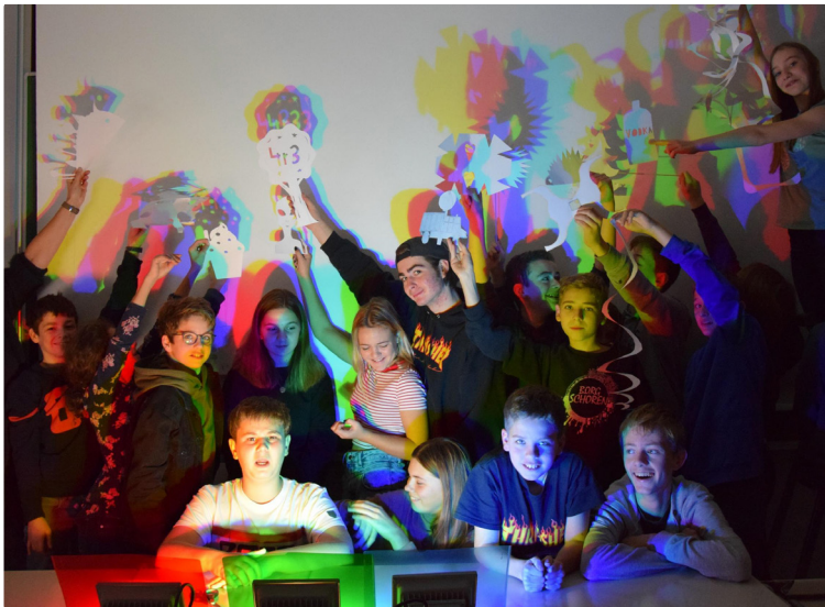
Teilnehmer|innen »technik bewegt 2019 | LichtGestalten« bei der Arbeit

Die Impulswochen »technik bewegt« finden heuer wieder als mehrwöchige Veranstaltung von 3. bis 30. November 2020 statt und bringen Jugendlichen die Aufgaben von Architekt|innen, Planer|innen und Ingenieurkonsulent|innen näher. »technik bewegt« gibt auf jugendgerechte und spannende Weise Einblick in planende technische Berufe und zeigt die Bedeutung der Arbeit von Ziviltechniker|innen für die Gestaltung unseres Lebensraums auf.