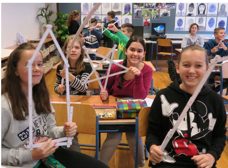
Teilnehmer|innen »technik bewegt 2017« bei der Arbeit

Die Impulswochen »technik bewegt« finden heuer wieder als mehrwöchige Veranstaltung von 5. bis 30. November 2018 statt und bringen Jugendlichen die Aufgaben von Architekt|innen und Ingenieurkonsulent|innen näher. »technik bewegt« gibt auf jugendgerechte und spannende Weise Einblick in planende, technische Berufe und zeigt die Bedeutung der Arbeit von Ziviltechniker|innen für die Gestaltung unseres Lebensraums auf.