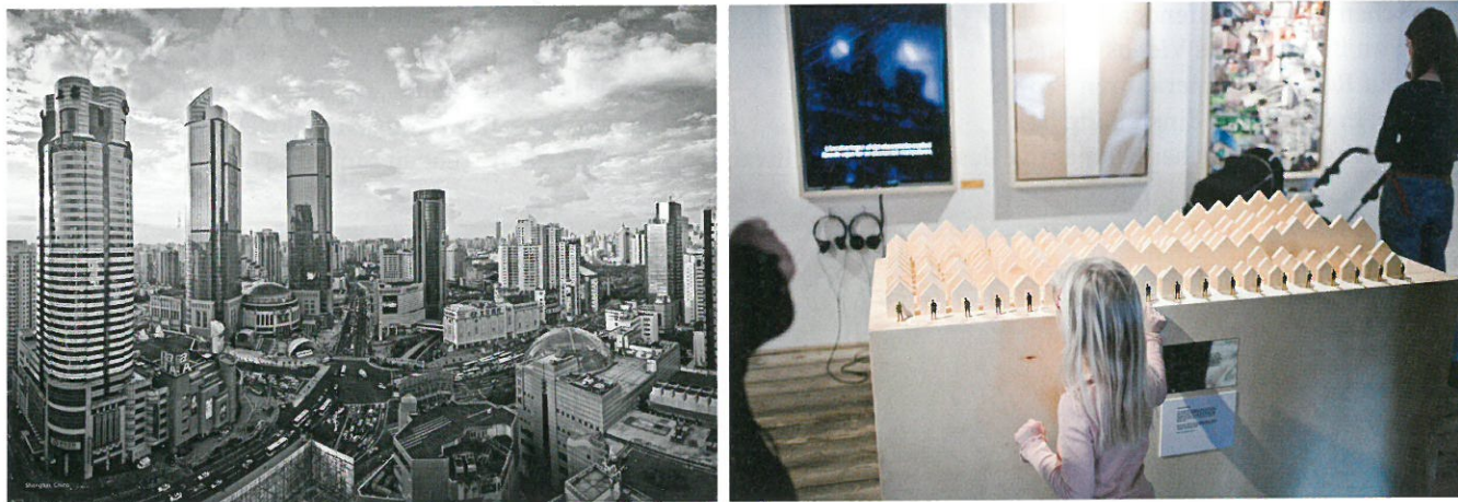
SHIFTS richtet sich an ein architekturaffines, urbanes Publikum, das sich wirtschaftlich und in seinen Hoffnungen an Aufschwung, an Wachstum, an globale Märkte und eine internationale Architektur bindet