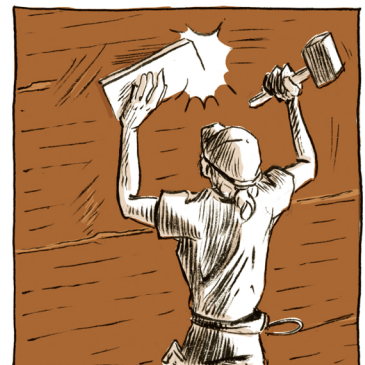
DIE FUGEN WERDEN VON HAND MIT DER ORIGINALMISCHUNG RETUSCHIERT.