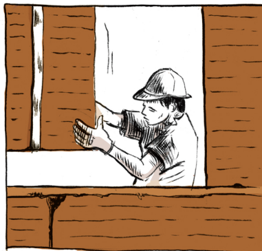
DIE VORGEFERTIGTEN MODULE WERDEN MIT LEHMMÖRTEL ZUSAMMENGEFÜGT.