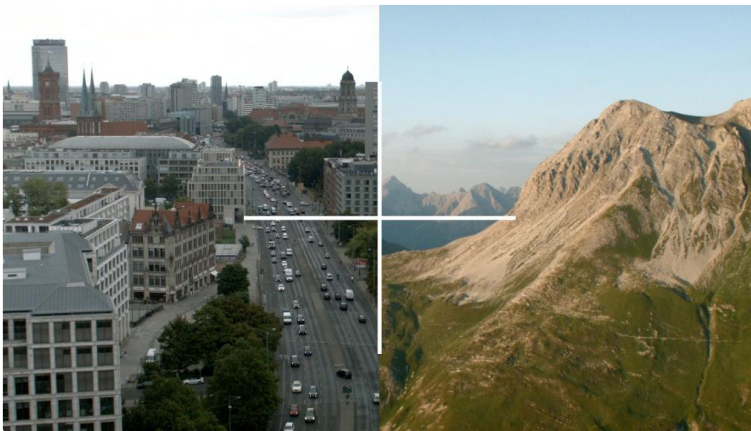
Quaternio aus »Architecting after Politics« | Brandlhuber+ und Christopher Roth, 2018