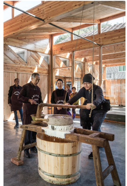
Xu Tiantian/DNA_Design and Architecture: Tofu Factory, Caizhai Village, Songyang, China, 2018 Architektin Xu Tiantian hat für den Bezirk Songyang in China eine Reihe von zusammenhängenden Interventionen zur Stärkung des ländlichen Raums entworfen; so die Tofu Fabrik in Ca-izhai, die gleichzeitig Produktionsstätte, öffentlicher Raum und touristischer Anziehungspunkt ist.

Mit der Ausstellung „Critical Care“ setzt das vai Vorarlberger Architektur Institut seinen Themenschwerpunkt im Bereich der ökologischen und sozialen Baukultur fort. So waren einige der beteiligten Architekturbüros und ihre Projekte bereits in Dornbirn zu sehen: de vylder vinck taillieu (2012), Lacaton & Vassal, Anna Heringer – Dipdii Textiles (beide 2019)