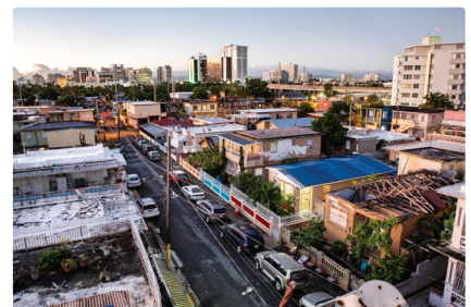
Corporación del Proyecto ENLACE del Caño Martín Peña (ENLACE) und G-8 Grupo de las Ocho Comunidades Aledañas al Caño Martín Peña, Inc.: Caño Martín Peña Community Land Trust, San Juan, Puerto Rico, 2014 ENLACE in San Juan, Puerto Rico, hat in einem mehrere Jahre dauernden Prozess von über 700 Konsultationen Grund und Boden, auf dem sich die informellen Siedlungen in nächster Nähe zum Finanzial District befinden, in einen Community Land Trust verwandelt und die ökologische Reparatur des Martín Peña Kanals vorangetrieben.