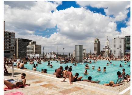
Paulo Mendes da Rocha und MMBB Architekt|innen: SESC 24 Maio, São Paulo, Brasilien, 2017 Paulo Mendes da Rocha und MMBB Architekt|innen haben ein modernistisches Kaufhausgebäude in São Paulo in ein soziales Kultur-, Sport- und Gesundheitszentrum umgebaut, das natürlich ventilierte, öffentlich zugängliche Räume bietet, mit Swimmingpool auf dem Dach.