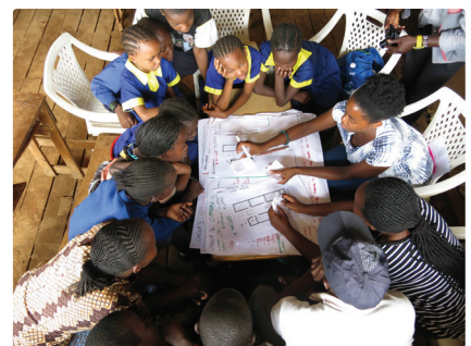
Kounkuey Design Initiative: Kibera Public Space Projekt, Nairobi, Kenia, seit 2006 Die Kounkuey Design Initiative entwickelt gemeinsam mit Grassroots Organisationen produktive öffentliche Räume in Kibera, Nairobi, um ökologische Anliegen, sanitäre Einrichtungen, lokale Alternativ-Ökonomien und Sicherheit miteinander zu verbinden.