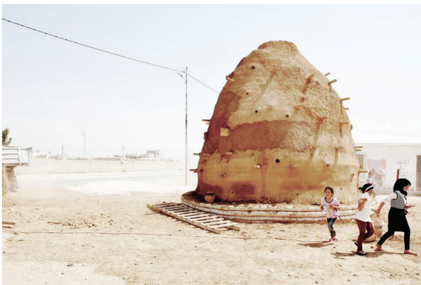
Quba Classrooms: Emergency Architecture & Human Rights (EAHR): 100 Klassenräume für geflüchtete Kinder, Za'atari Village, Jordanien, 2017