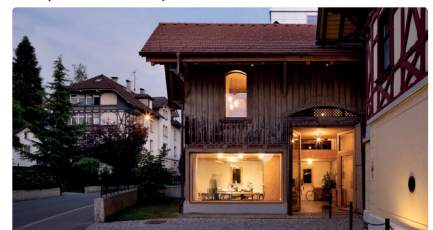
Atelier Klostersgasse