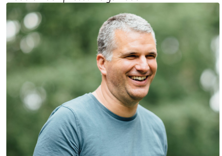
Markus Zilker | Foto: heshaoahui.com