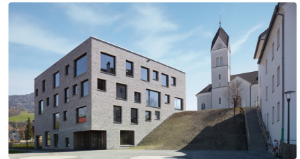
Kinderhaus Sulz | Foto: Adolf Bereuter

Bauherrschaft: Philipp Nußbaumer und Julia Kick Architektur: Julia Kick Architekten zT, Dornbirn Fertigstellung: 2017