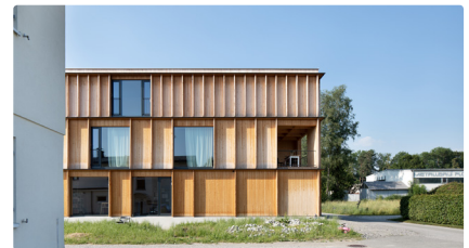
Tempel 74 Mellau