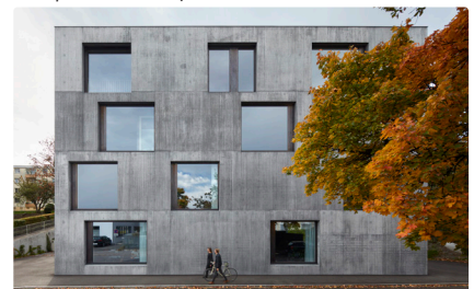
Atelier Klostergasse