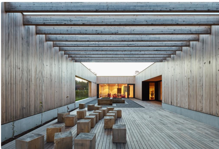
Volksschule Unterdorf, Höchst | Bauherrschaft: Gemeinde Höchst | Architektur: Dietrich|Untertrifaller Architekten