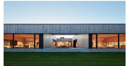
Volksschule Unterdorf | Foto: Bruno Klomfar