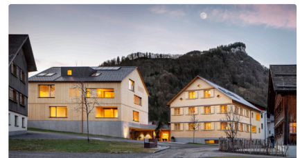
Tempel 74 Mellau