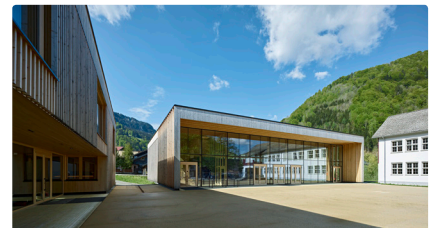
Gemeindebauten Mellau