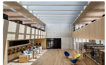
Stadtbibliothek Dornbirn