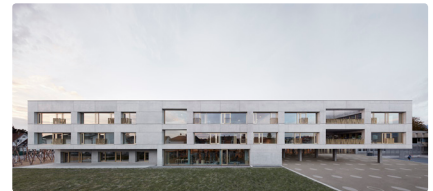
Schule Schendingen

Bauherrschaft: Bernardo Bader Architektur: Bernardo Bader Architekt ZT GmbH, Bregenz Fertigstellung: 2019