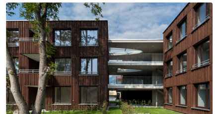
Stadtbibliothek Dornbirn