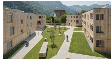
Wohnsiedlung Maierhof