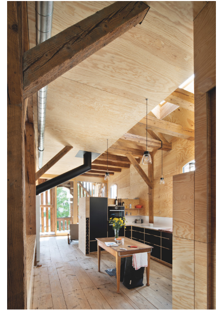
Ökonomiegebäude Josef Weiss | Architektur: Julia Kick Architekten