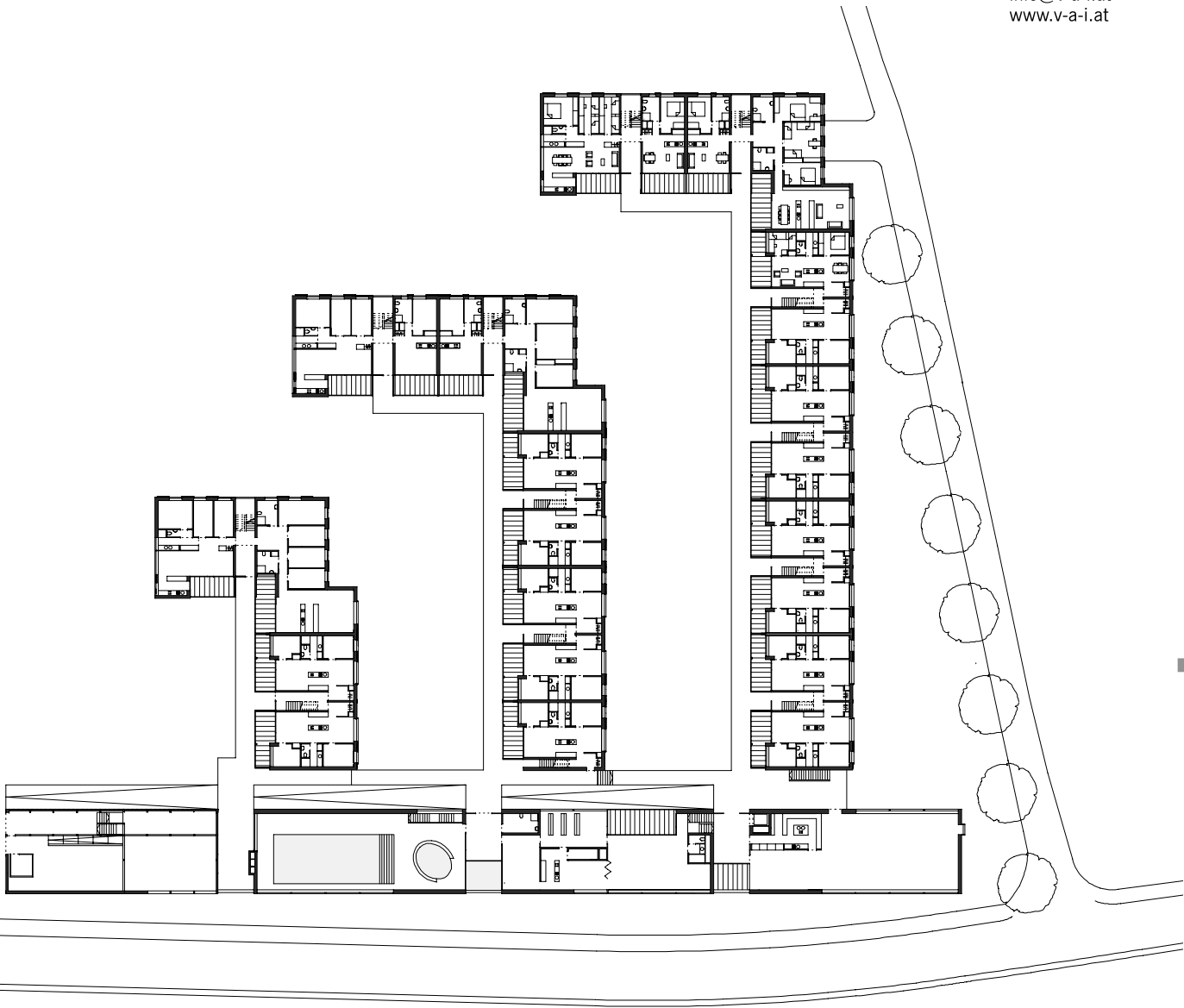
Grundriss EG 1:500

Realschulstraße 6|7 A-6850 Dornbirn Tel +43 (0)5572 51169 info@v-a-i.at www.v-a-i.at